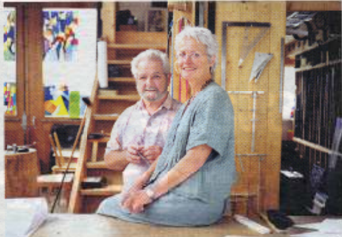
Les deux artisans collaborent depuis trente ans.